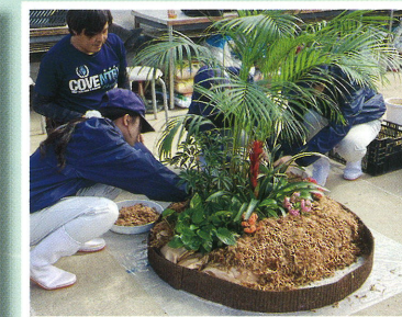
↳ 室内園芸装飾技能検定の練習